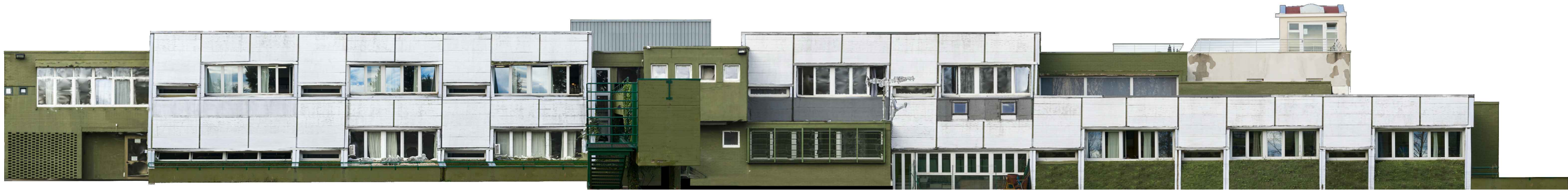
PROSPETTO LATO CAMPETTI