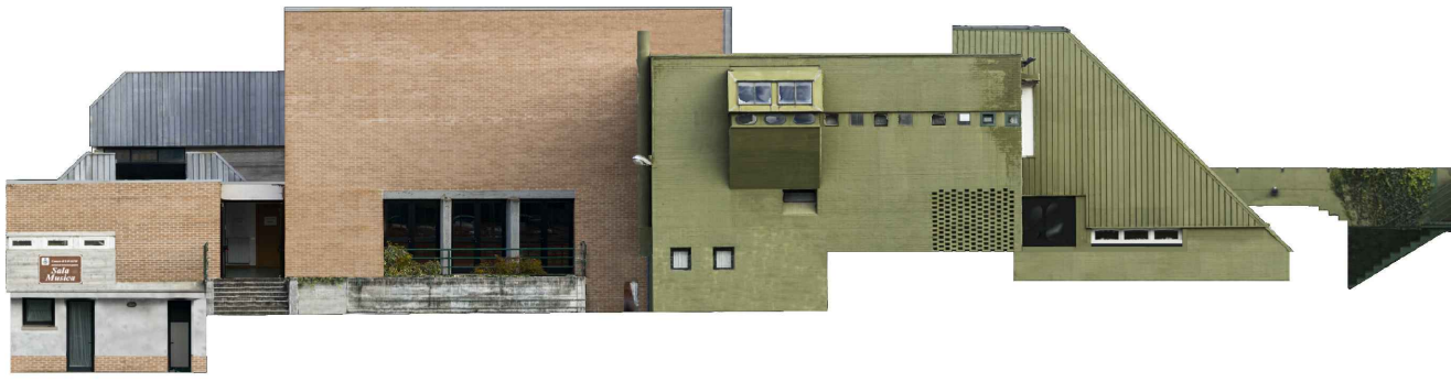
PROSPETTO LATO PALESTRA